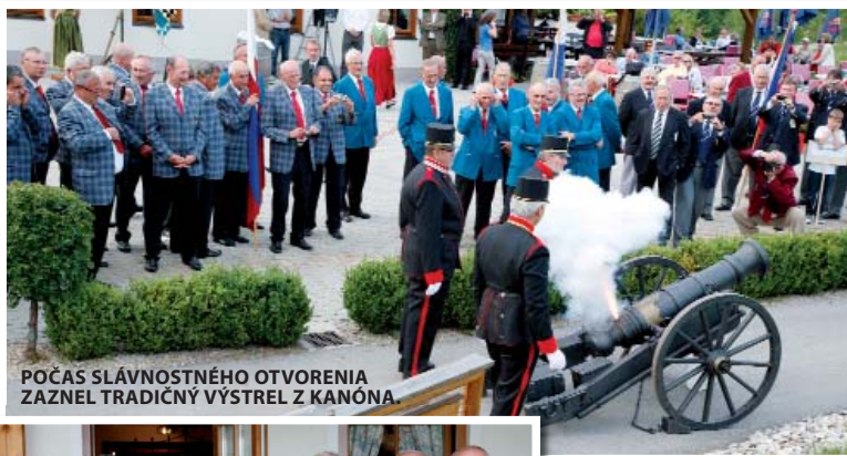
POČAS SLÁVNOSTNÉHO OTVORENIA ZAZNEL TRADIČNÝ VÝSTREL Z KANÓNA

Šesť krajín, ktoré boli kedysi súčasťou K + K Monarchie, sa pravidelne strieda v organizovaní zápolenia seniorských družstiev. Tohtoročný turnaj privítal súťažiace tímy v malebnom vinohradníckom kraji v okolí Kremsu. O putovné trofeje sa bojovalo od 1. do 4. augusta na ihrisku GC Lengenfeld – Kamptal. [TEXT: JÁN PEČO]